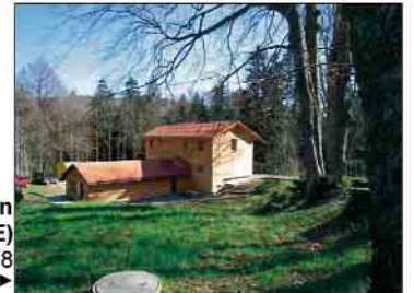
Chalet L'Abri du Van Noiraigue (NE) www.groups.ch/fr/K-9274-8388