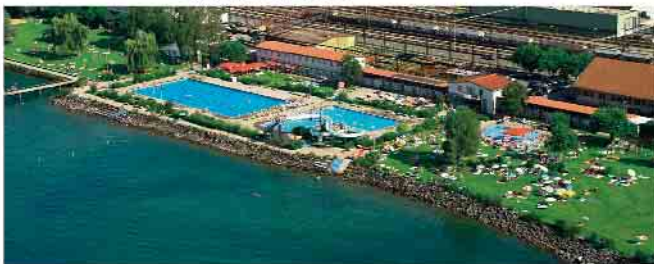
Herberge Rorschach Rorschach (SG) www.groups.ch/fr/K-7480-6318

CONTACT groups.ch Hôtels et maisons de vacances pour groupes Spitzackerstrasse 19 - Case postale 4410 Liestal Tél. 061 926 60 00 www.groups.ch / www.seminar-groups.ch m.groups.ch