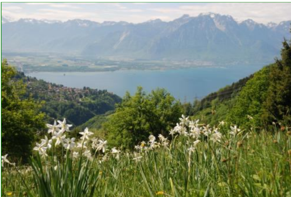
Narzissen auf dem südlichen Abhang des Cubly.