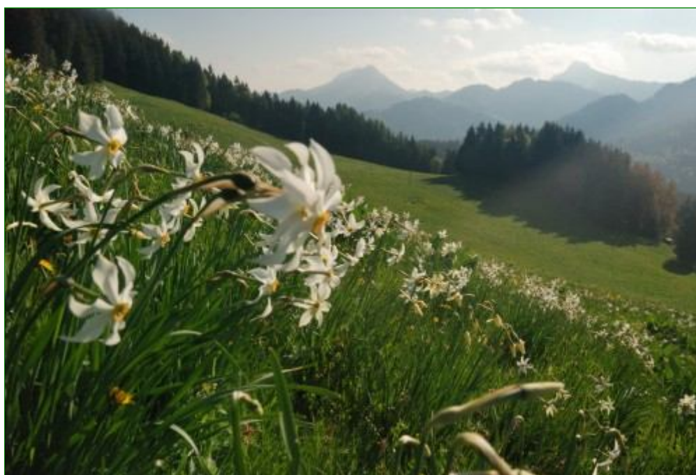
Narcisses proche du sommet des Pléiades.