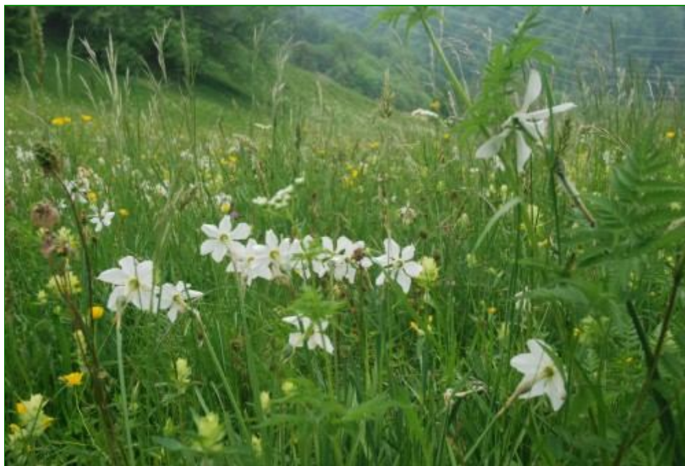
Narcisses au lieu-dit Les Cerisiers.