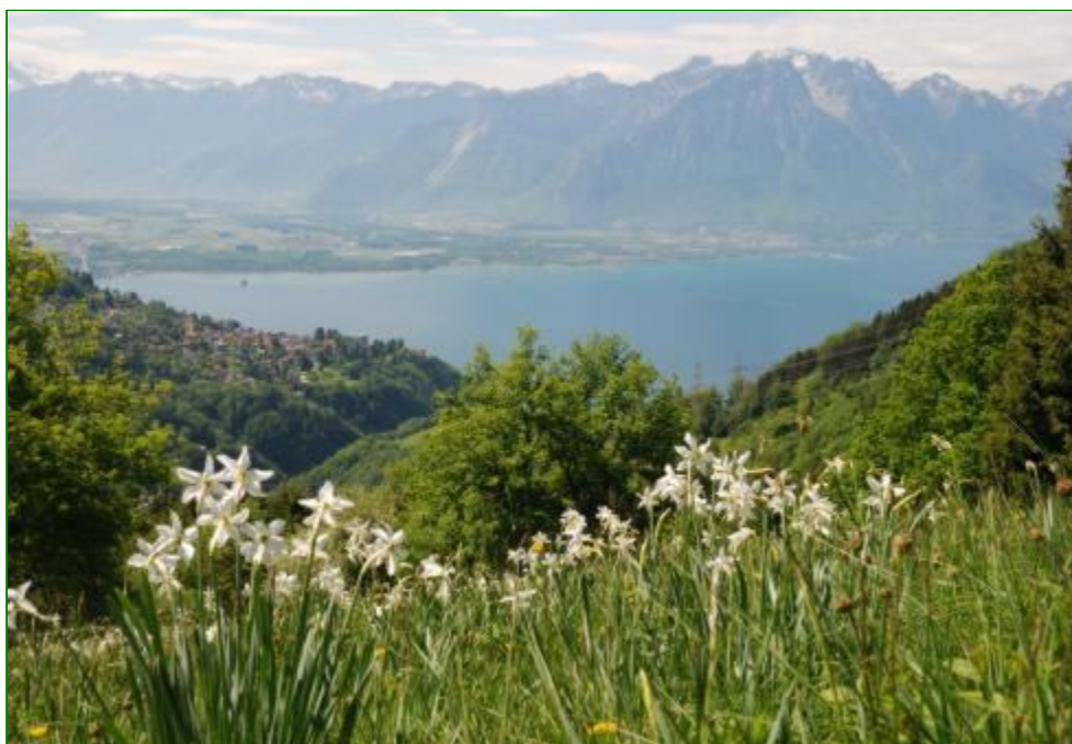
Narcisses sur le versant Sud du Cubly.